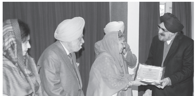
Dr.N.S.Kapany being honoured by Mrs. Gursharan Kaur during Bhai Vir Singh's Birthday Celebration in December, 2015.