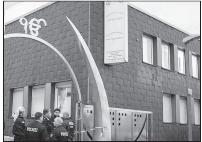
Essen Gurdwara, Germany

The Indian community at 35,000 is barely 0.04 per cent as a percentage of a population of 82 million. Of these, only 10,000 Indians are estimated to have acquired